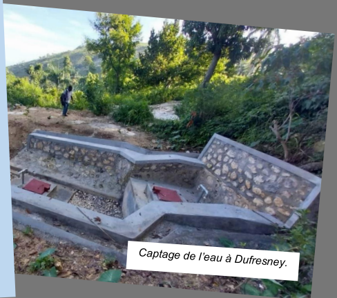
Captage de l'eau à Dufresney.

Cabinet spécialisé dans l'étude, la supervision et l'exécution de travaux de construction, rénovation et réparation d'immeubles publics et privés. Intervient aussi dans l'assainissement, le traitement de l'eau et l'hydraulique. Peut évaluer des bâtiments et superviser des travaux pour le secteur public ou privé. Fondé en janvier 2015, basé à Port-au-Prince. C'est MEC qui met techniquement en œuvre notre projet d'eau avec une grande compétence dans la commune de Carrefour (Bois Djoute, Dufresney et Procy).