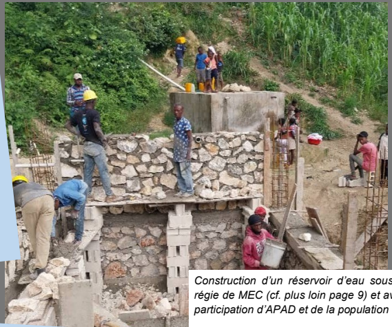
Construction d'un réservoir d'eau sous la régie de MEC (cf. plus loin page 9) et avec participation d'APAD et de la population

APAD (Association pour l'Avancement de Dufresnay) Organisation rurale sans but lucratif créée en 1990, qui soutient les communautés rurales de Dufresnay, Procy et Taïfer (Carrefour, Haïti) pour améliorer durablement leurs conditions de vie. Intervient dans le développement rural, agricole, l'éducation et l'accès à l'eau.