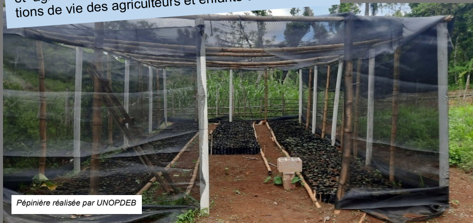
Pépinière réalisée par UNOPDEB

Organisation rurale fondée en 1990, qui soutient les populations vulnérables des 13 sections communales de Carrefour (Haïti). Elle agit pour le développement rural, agricole, l'éducation et l'accès à l'eau, avec une forte présence locale.