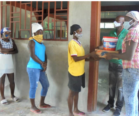
Kits d'hygiène distribués à Rivière froide

Une période de sécheresse prolongée du mois de décembre au mois d'avril a provoqué des pertes énormes, et les populations n'avaient plus rien à manger.