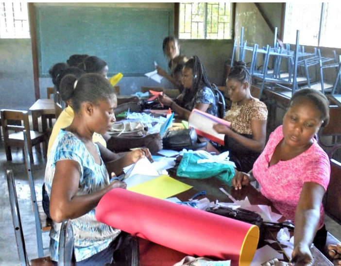
Die Lehrkräfte bereiteten kindgerechtes Material vor

Auch die Eltern waren von der neuen Methode begeistert, die die Beteiligung von Schülern und Lehrern fördert.