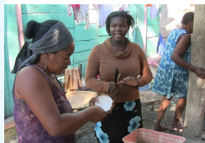
La vidéo montre la préparation d'un menu haïtien

An diesem Tag wurde die Kulinarik gefeiert. Haïtianische Rezepte, Fotos von der letzten „Cuisine du Monde“ und ein Video von der Zubereitung eines haïtianischen Menüs wurden geteilt.