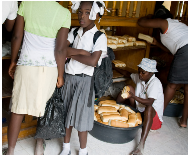
Une mère vend du pain pour financer l'écolage de ses enfants

Dans l'un des projets d'OTM, cela a été partiellement réalisé grâce à la création de la boulangerie FOCA-PA pour soutenir l'École Haïtiano-Luxembourgeoise. Les bénéficiaires contribuent au financement de l'école, avec l'avantage supplémentaire que les parents des élèves sont rémunérés en vendant le pain de la boulangerie et peuvent ainsi contribuer à financer l'éducation de leurs enfants.