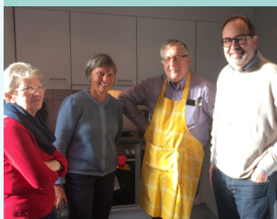
Ein Teil des OTM Vorstandes bei der Cuisine du Monde im Dezember 2019.

An diesem Tag wurde die Kulinarik gefeiert. Haïtianische Rezepte, Fotos von der letzten „Cuisine du Monde“ und ein Video von der Zubereitung eines haïtianischen Menüs wurden geteilt.