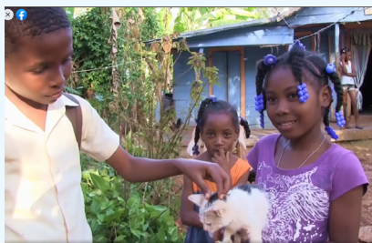
Des vidéo montrent comment les enfants jouent en Haïti

An diesem Tag ging es um das Thema Kindheit in Luxemburg und in Haïti, Erfahrungen von adoptierten Haïtianern in Luxemburg, sowie die Arbeit von OTM in Luxemburger Grundschulen.