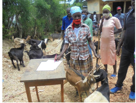
Une dame reçoit de chèvres pour l'élevage

OTM est intervenu avec une aide d'urgence en finançant la distribution de kits hygiéniques et de la nourriture à 1100 familles, réparties sur différentes communes.