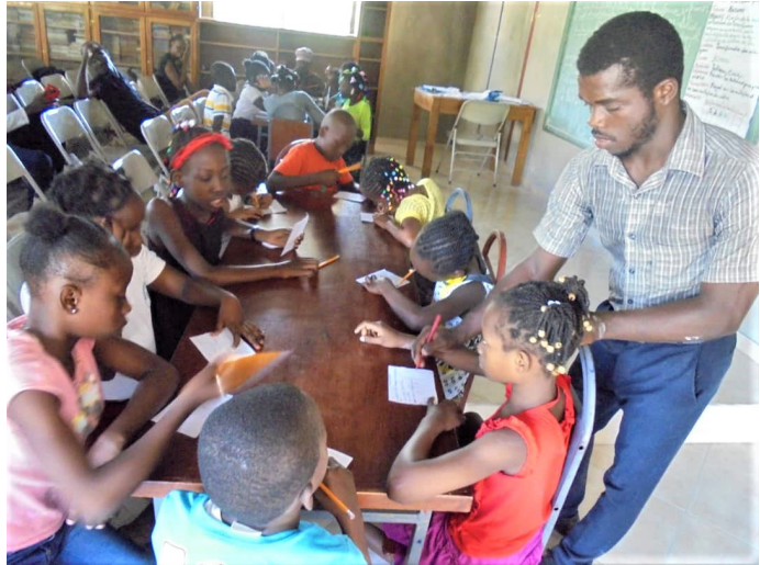
Un instituteur de l'école de Bertin fait participer les enfants

Un jury composé d'instituteurs de toutes les classes a sélectionné la meilleure leçon sur la base de