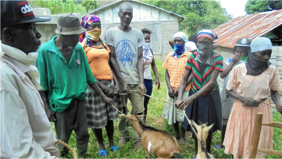
In Gro Trou erhalten mehrere Bauern Ziegen als wichtiges wirtschaftliches Standbein

Das Coronavirus hat sich seit März 2020, wie überall auf der Welt, auch in Haiti verbreitet. Der haitianische Präsident Jovenel Moïse rief einen Notstand aus und führte eine Reihe von Maßnahmen ein, um die Ausbreitung des Virus zu verhindern.