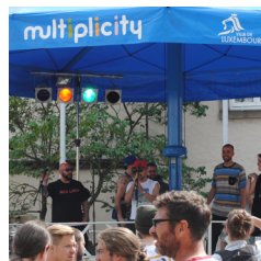
Pachamama lors du Festival de l'Esprit Critique en 2018.

Am Tag der Musik wurden Videos aus Luxemburg und Haiti gepostet, von Bands, die teilweise auf OTM-Festivals gespielt haben.