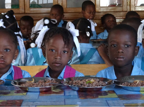
Eine warme Mahlzeit am Tag in der Schulkantine

Seit dem Auftreten des Coronavirus in Haiti waren die Schulen über mehrere Monate geschlossen, um die Ausbreitung des Virus zu verhindern. Während dieser Zeit waren die Kinder aus benachteiligten Familien vom Hunger bedroht, denn ihre einzige tägliche Mahlzeit hatten sie in der Schulkantine gegessen. Während des Lockdowns konnten es sich ihre Eltern kaum leisten, die ganze Familie zu ernähren.