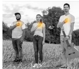
KINEMA Luxembourg beim Festival 2018