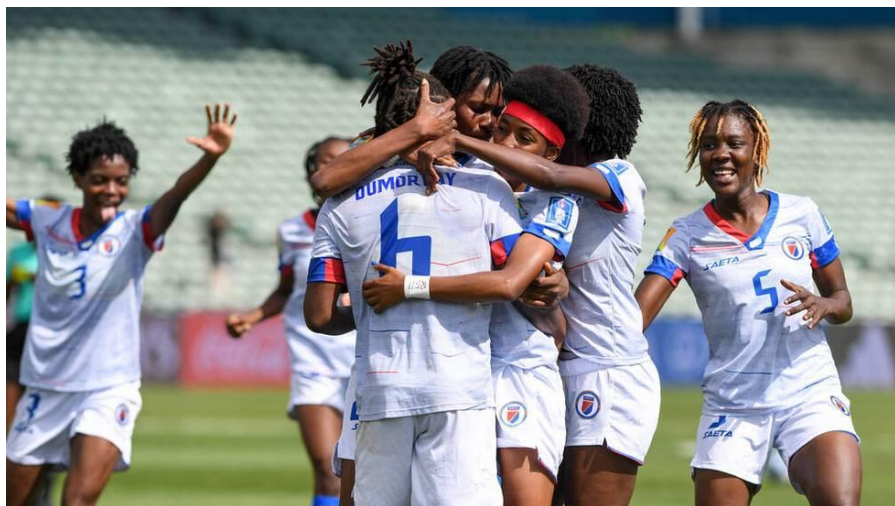
Participation de l'équipe d'Haïti féminine au championnat mondial de foot

malgré les restrictions économiques, politiques et sociales, et que par exemple des événements culturels et sportifs apportent de la joie au pays ; comme la participation de l'équipe féminine à la coupe du monde de football en Australie et en Nouvelle-Zélande. C'était la première fois dans l'histoire d'Haïti, et donc un moment très marquant, que l'équipe féminine pouvait se mesurer à un si haut niveau. En dépit de leur élimination après trois tournois, les Haïtiens dans le monde entier sont certainement très fiers de ce succès.