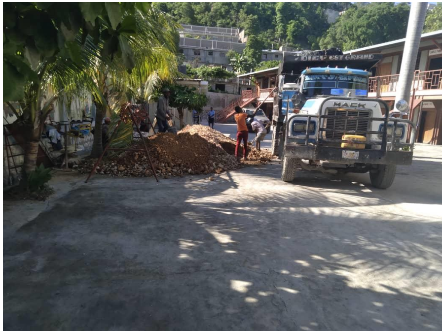
Renouvellement de la fosse septique à l'école de Bertin

OTM remercie sincèrement ses partenaires pour leur bonne collaboration, ainsi que le ministère des Affaires étrangères luxembourgeois et les donateurs privés pour leur soutien financier aux projets scolaires.