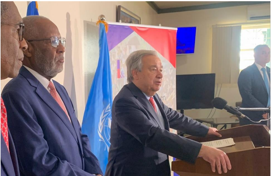
UN-Generalsekretär António Guterres während einer Pressekonferenz in Port-au-Prince

Obwohl das Land immer wieder von negativen Schlagzeilen, hauptsächlich in Port-au-Prince, überschattet wird und die Lage hoffnungslos erscheint, erreichen uns ab und zu positive Meldungen, die zeigen, dass das Leben der Haitianer, trotz ökonomischen, politischen und sozialen Einschränkungen nicht stillsteht und z. B. kulturelle und sportliche Ereignisse dem Land Freude bereiten; so auch die Teilnahme der Frauenmannschaft an der Fußballweltmeisterschaft in Australien und Neuseeland. In der Geschichte Haitis war es das erste Mal und damit ein sehr prägender Moment, dass sich die Frauenmannschaft auf solch hohem Niveau unter Beweis stellen durfte. Trotz frühen Ausscheidens nach drei Turnieren sind die Haitianer auf der ganzen Welt sicherlich mächtig stolz auf diesen Erfolg.