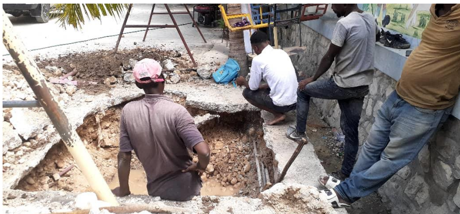
Erneuerung der Klärgrube in der Schule Bertins

OTM bedankt sich hiermit ganz herzlich bei seinen Partnern für die gute Zusammenarbeit, sowie beim luxemburgischen Außenministerium und privaten Spendern für die finanzielle Unterstützung der Schulprojekte.