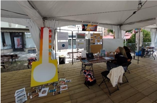
Stand der Gruppe „Planet“

Am 30. Juni fand auf der „Place Clairefontaine“ in Luxemburg-Stadt die erste Ausgabe des Events „Lët'z Cooperate“ mit Informationsständen zur luxemburgischen Entwicklungshilfe und spannenden Sensibilisierungsaktivitäten rund um die