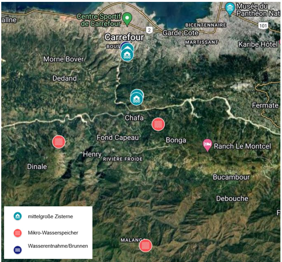
5 Sektionen der Gemeinde Carrefour wurden für das Wasserprojekt zurückbehalten

Priorisierung – Die anfängliche Analyse hat ergeben, dass es viel mehr Orte mit Wasserbedarf gibt, als erwartet, und demnach OTM nicht alle finanziell im Kontext eines Projektes unterstützen kann. Demnach mussten nach einer genauen Kostenberechnung die Regionen nach Dringlichkeit ausgewählt werden, wo in diesem Projekt Wassersysteme installiert, werden können – eine Auswahl, die uns nicht leicht gefallen ist. Nach all diesen Schritten liegt jetzt ein recht detailliertes Konzept vor, welches bei einer Genehmigung durch das Außenministerium gezielt an den entsprechenden Orten in den nächsten 3 Jahren umgesetzt werden kann.