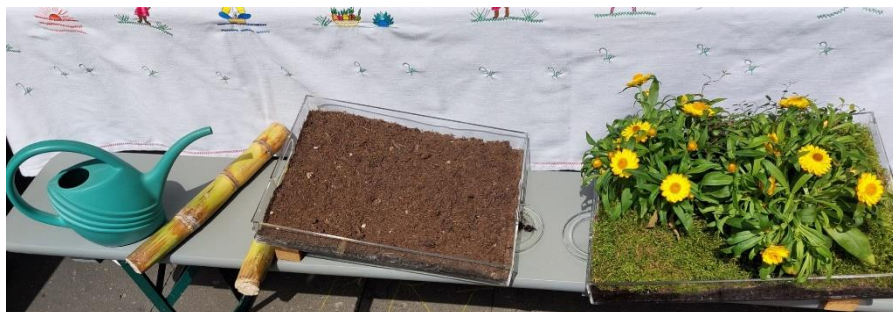
Vitrines inclinées pour illustres la problématique d'érosion/conservation de sol

Un grand merci à tous nos bénévoles qui nous ont aidé et les personnes qui nous ont rendu visite !