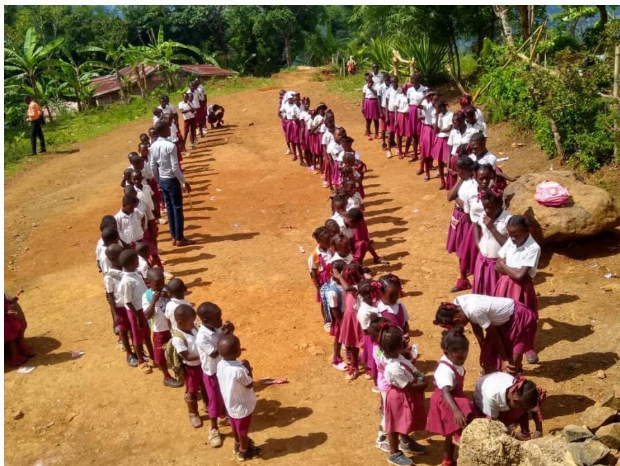
Étudiants de l'école Gauthier

communautaire, ils peuvent participer à des formations pour améliorer leurs compétences et connaissances dans le secteur commercial et assurer à l'avenir de manière autonome l'approvisionnement de la population en produits de première nécessité. Il s'agit donc d'une situation bénéfique pour tous les habitants de la région.