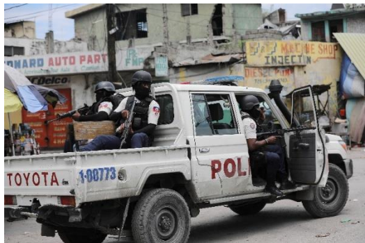
Des policiers armés surveillent les quartiers de Port-au-Prince