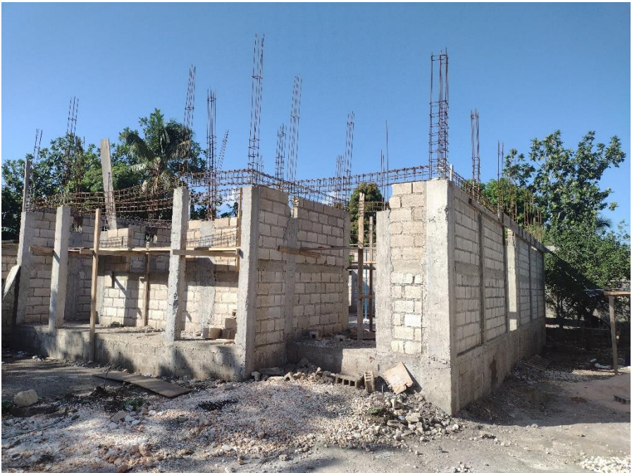
Bau des Gemeinschaftsladens in Léogâne

Gewinne sollen in Zukunft zur nachhaltigen Finanzierung und Aufrechterhaltung der Schulen genutzt werden. Die Bildung der Kinder wird somit sichergestellt und ebenso besteht auch die Möglichkeit für deren Eltern und andere kleine Händler, sich an der Verteilung und dem Verkauf der Waren aus dem Gemeinschaftsladen zu beteiligen, um ihre Einkünfte zu erhöhen. Neben deren Integration in dieses Netzwerk des Wiederverkaufs von Produkten aus dem Gemeinschaftsladen können sie an Schulungen teilnehmen, um ihre Fähigkeiten und Kenntnisse im Bereich des Einzelhandels zu verbessern und zukünftig die Versorgung der Bevölkerung mit Grundnahrungsmitteln autonom zu gewährleisten. Demnach handelt es sich um eine Win-win-Situation für alle Bewohner in der Umgebung.