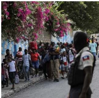
Menschen auf der Flucht