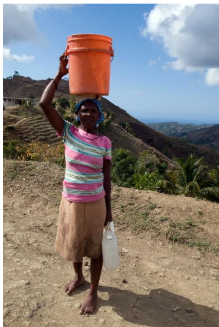
Souvent les femmes et les filles s'occupent de l'approvisionnement en eau

mentionner que ces conditions ne sont pratiquement pas données en Haïti et que la majorité des villages et des villes présentent toujours de sérieuses lacunes en matière d'approvisionnement en eau et en électricité.