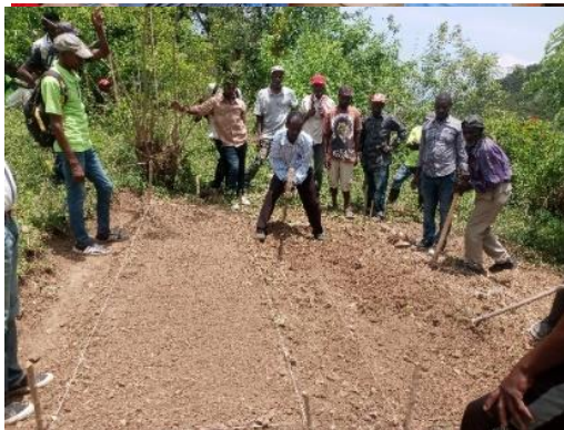
Vorbereitung der Böden für die Aussaat