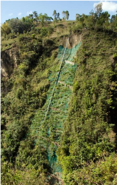
Bau eines Wasserleitsystems in den Berghängen

Eine kürzlich erfolgte Evaluierung von OTM über das errichtete Wasser- und Stromversorgungssystem, das 2500 direkte Begünstigte und 6000 Begünstigte insgesamt (direkt und indirekt) mit Trinkwasser versorgt, bestätigt die oben beschriebenen Verbesserungen für die Lebensqualität der haitianischen Bevölkerung. Dennoch ist es wichtig zu erwähnen, dass solche Bedingungen fast nicht gegeben sind in Haiti und es in der Mehrheit der Dörfer und Städte immer noch erhebliche Mängel bezüglich der Wasser- und Stromversorgung gibt.