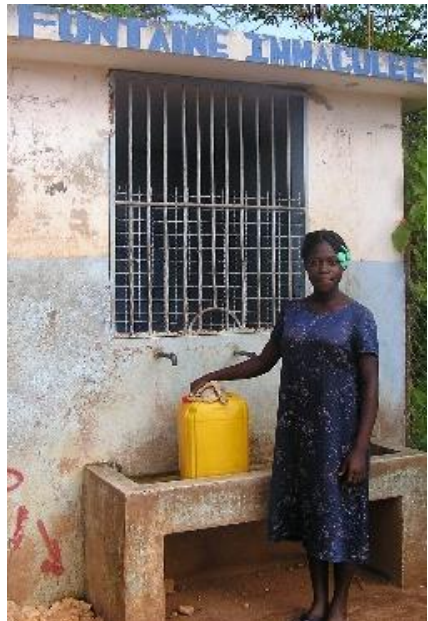
Errichtung eines Wasserkiosks