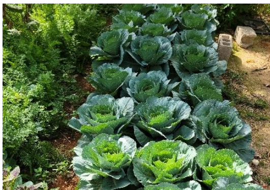
Cultivation de chou