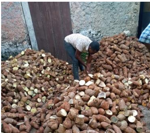
Récolte des racines d'igname

distribués l'année dernière à un total de 664 familles de paysans. Les bénéficiaires ont reçu des conseils techniques et un soutien de la part de l'université de Fondwa, qui accompagne le projet en continu. Selon les descriptions ci-dessus, la première récolte a été satisfaisante malgré une période de sécheresse. Ceci dans l'espoir que la prochaine récolte sera aussi fructueuse que la précédente pour les familles de paysans.