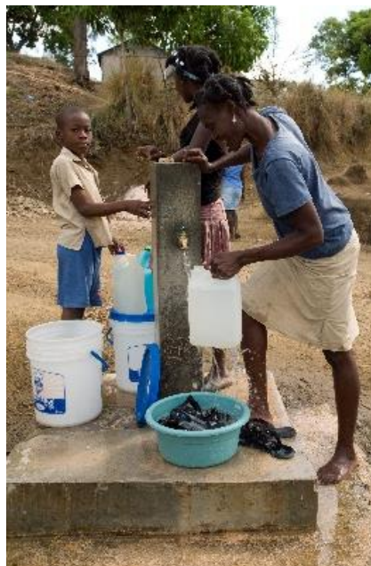
Système d'approvisionnement en eau