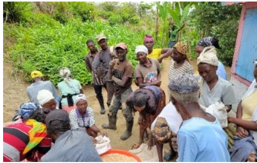
Verteilung der Samen an die Bauernfamilien

Léogâne beheben. Demnach wurden letztes Jahr Samen und verschiedene landwirtschaftliche Geräte an insgesamt 664 Bauernfamilien verteilt. Technische Beratung und Unterstützung erhielten die Begünstigten von der Universität Fondwa, die das Projekt kontinuierlich begleitet. Wie die obigen Schilderungen zeigen, war die erste Ernte trotz einer Trockenperiode vielversprechend. Diese lässt erhoffen, dass die bevorstehende Ernte ebenso erfolgreich für die Bauernfamilien sein wird.