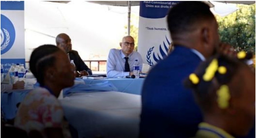
Dienstreise von Volker Türk nach Haiti (Mitte)

Einen spannenden Beitrag des „Deutschlandfunk“ zu diesem Thema finden Sie unter folgendem Link: https://bit.ly/3Y9MgDM