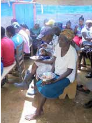
Verteilung von Lebensmitteln.