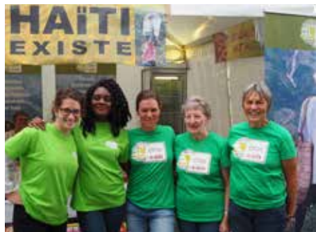
Stand de sensibilisation au Luxembourg.

Si vous voulez nous rejoindre, écrivez-nous à info@otm.lu .