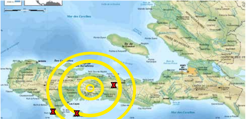
Drei der 19 Missionen unserer Projektpartner sind vom Erdbeben betroffen.