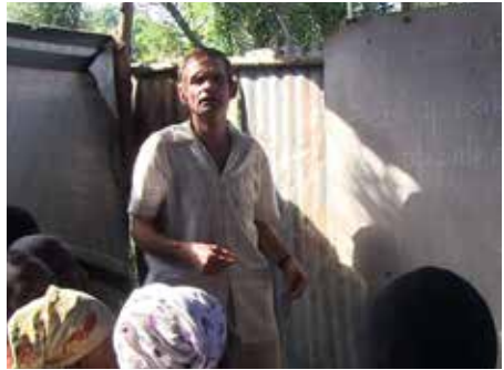
Consultation des centres de formation pour adultes en Haïti

Nous recherchons encore des bénévoles pour soutenir les projets de développement ainsi que les activités au Luxembourg.