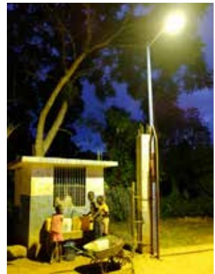
Kiosque à eau avec lampadaire.

La nouvelle structure représentative est sur le point de prendre en charge le projet eau-électricité. Les kiosques à eau et les lignes privées ont été réparés et des compteurs ont été installés. La gestion du système eau-électricité a été améliorée avec l'aide du conseiller local. Les plans d'affaires établis indiquent qu'une fois toutes les activités terminées, le système pourra fonctionner de manière rentable.