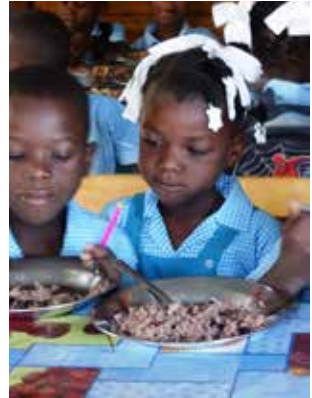
Cantine de l'école EHL.

Die Aktions- und Wirtschaftlichkeitspläne für ein unabhängigeres Funktionieren der OTM-Partnerschulen werden nach und nach entwickelt und umgesetzt. Dabei wird die Anzahl der Schüler, die Ausgaben für Schule und Kantine, der Beitrag der Eltern und der Beitrag neuer gewinnbringender Aktivitäten je Schule so aufeinander abgestimmt, dass die Schulen in Zukunft unabhängig von äußerer Hilfe funktionieren können, ohne die soziale Leitidee der Schulen außer Acht zu lassen.