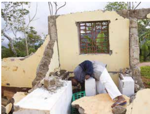
Un frère des Petites Frères de Sainte Thérèse cherche dans les décombres.

Enfin, la distribution des biens de secours se fait par l'intermédiaire des chefs des regroupements paysans, qui connaissent et atteignent toutes les familles dans le besoin.