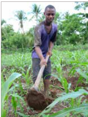
Bauer bei der Feldarbeit.

Ziel ist es, den landwirtschaftlichen Gemeinschaften eine Lebensgrundlage zu schaffen und sie weniger anfällig für klimatische und natürliche Katastrophen zu machen. Resistente Pflanzen, Maßnahmen zum Schutz des Bodens, effiziente Bewirtschaftung, Wasserbeschaffung je nach Bedarf, wirtschaftlicher Kauf und Verkauf der benötigten bzw. erzeugten Produkte werden mithilfe kompetenter lokaler Experten eingeführt.