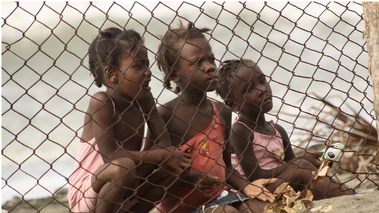
La population haïtienne est gravement touchée par la crise, décrite par l'UE comme « crise oubliée ».

monde. De même pour la situation actuelle en Haïti, dont les gens semblent être peu informés. Depuis quelques années déjà, l'Union européenne décrit la situation dans le pays comme une « crise oubliée », qui peut être décrite comme une crise humanitaire grave et de longue durée, avec une aide internationale insuffisante ou quasi inexistante pour y réagir. Comme le sujet n'est guère abordé par les médias, il est difficile de prendre des mesures au niveau politique pour faire face à la situation.