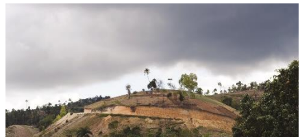
Zunehmende Entwaldung in Haiti

Die europäische Bevölkerung und Politik hingegen werden sich erst jetzt, nach der Pandemie und dem Beginn des Ukrainekrieges, der Restriktionen im Zugang zu lebensnotwendigen Ressourcen und der Verknappung lebensnotwendiger Ressourcen bewusst. Die Folgen des Ukrainekrieges haben bspw. dazu geführt, dass der Import von Weizen aus der Ukraine und Gas aus Russland drastisch reduziert wurden und