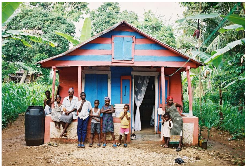
Portrait d'une famille haïtienne